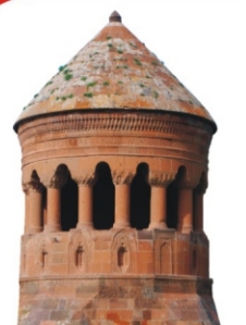
Emir Bayındır Kümbeti - 1481