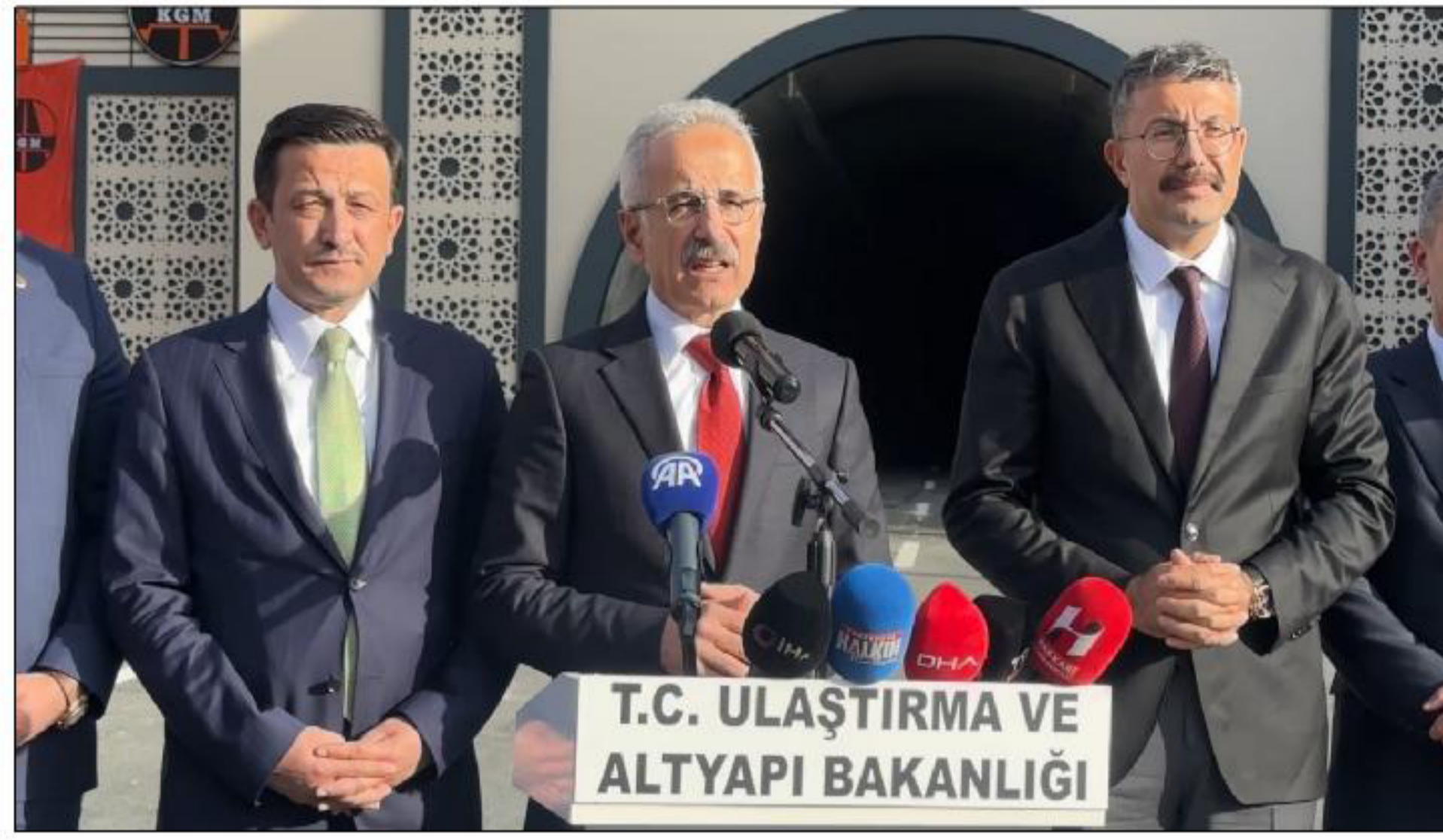
T.C. ULAŞTIRMA VE ALTYAPI BAKANLIĞI

Ulaştırma ve Altyapı Bakanı Abdulkadir Uraloğlu, Yüksekova-Van arasında bulunan Yeniköprü Tüneli'nde incelemelerde bulundu.