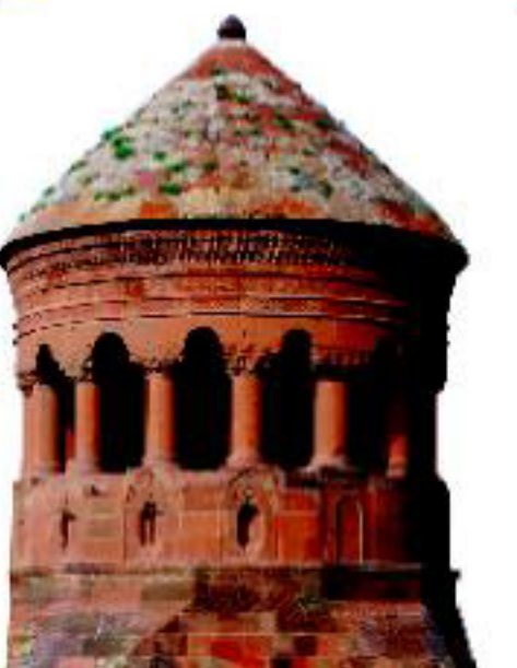
Emir Bayındır Kümbeti - 1481