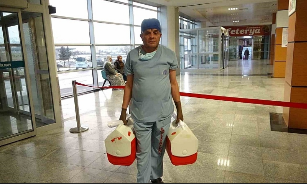
Baştarafı Sayfa 1'de Bitlis'te beyin ölümü gerçekleşen 44 yaşındaki hastanın iki böbreği Diyarbakır'daki iki hastaya umut oldu.