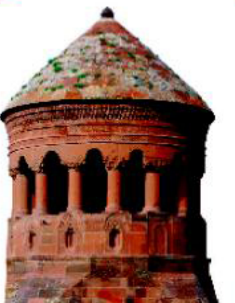
Emir Bayındır Kümbeti - 1481