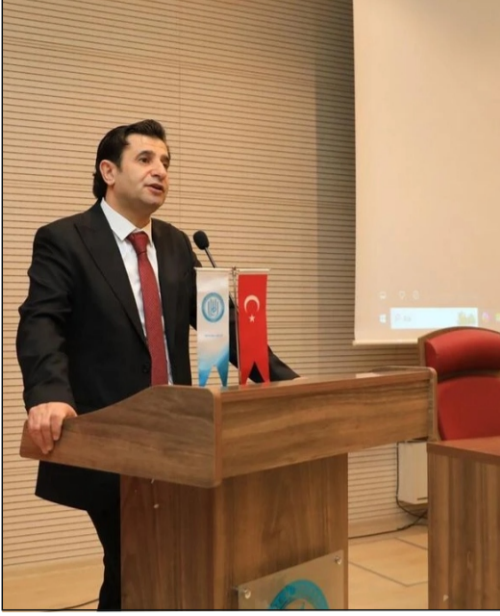
Bitlis Eren Üniversitesi'nde (BeÜ), İstiklâl Marşı'nın kabulünün 104. yılı dolayısıyla