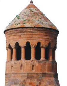
Emir Bayındır Kümbeti - 1481