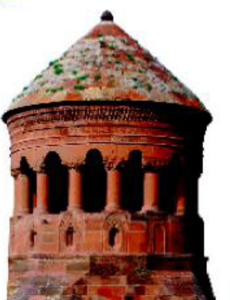
Emir Bayındır Kümbeti - 1481