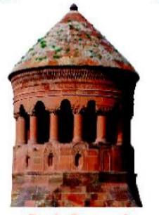
Emir Bayındır Kümbeti - 1481