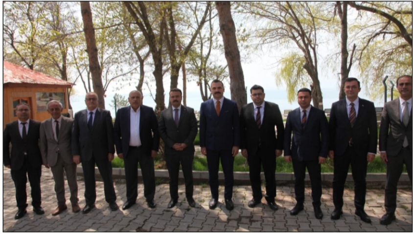
sahipliğinde gerçekleştirilen çalıştay, Ahlat Mesleki ve Teknik Anadolu Lisesi

noktada çalıştayımızın bir kez daha hayırlı olmasını diliyorum." "Türkiye'nin