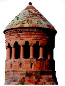
Emir Bayındır Kümbeti - 1481